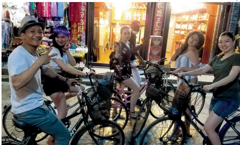
С китайскими друзьями на велопробулке

Среди китайской молодежи очень популярно высшее образование, но не каждый школьник в этой стране может поступить в университет. Я благодарна своей России и в первую очередь Горному университету за то, что стала дипломированным специалистом и получила возможность продолжить свое образование за рубежом».