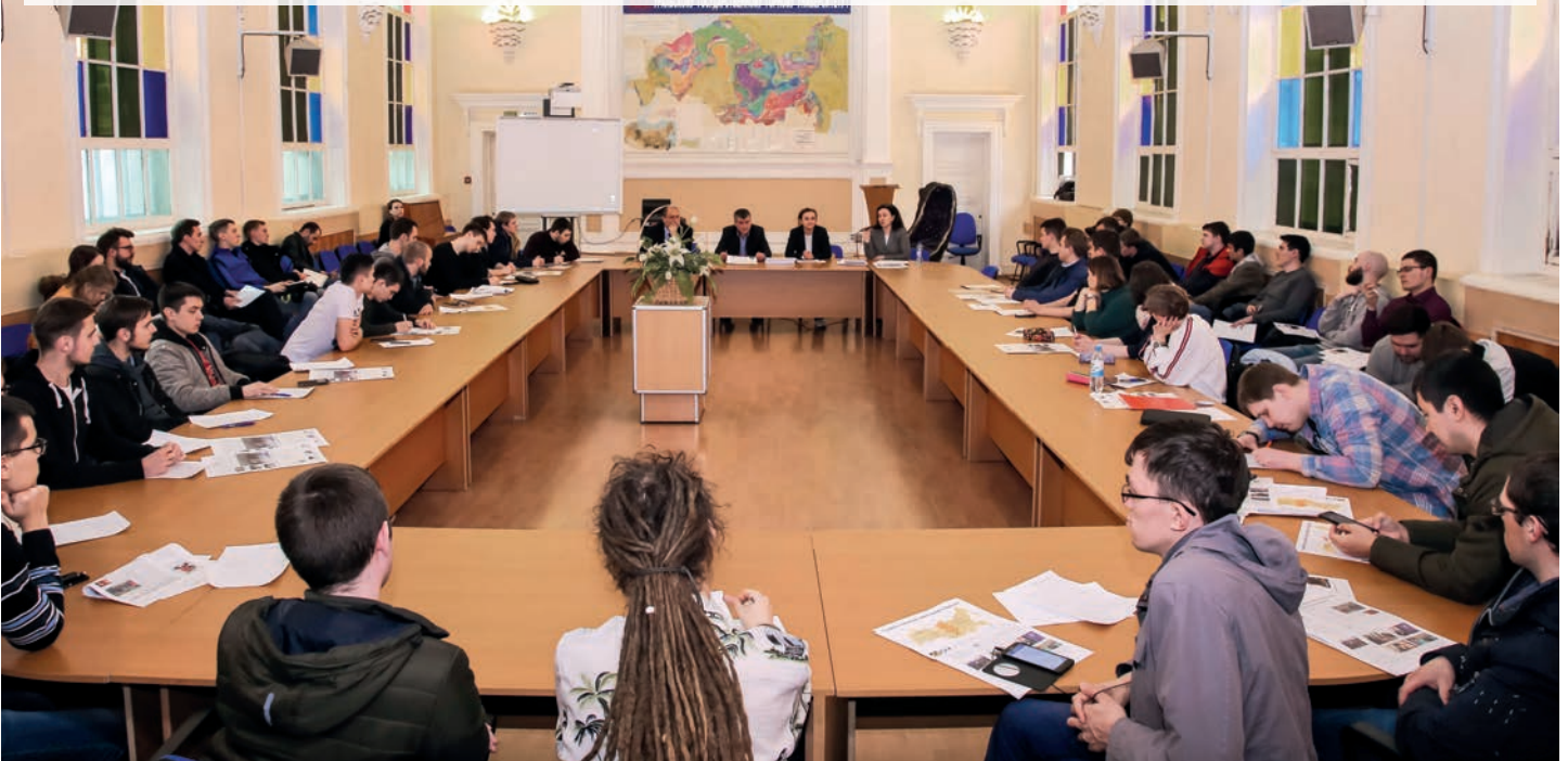
Встреча представителей АО «Южуралзолото Группы Компаний» — одного из лидеров в России по добыче золота — со студентами Горного университета (апрель 2018 г.)