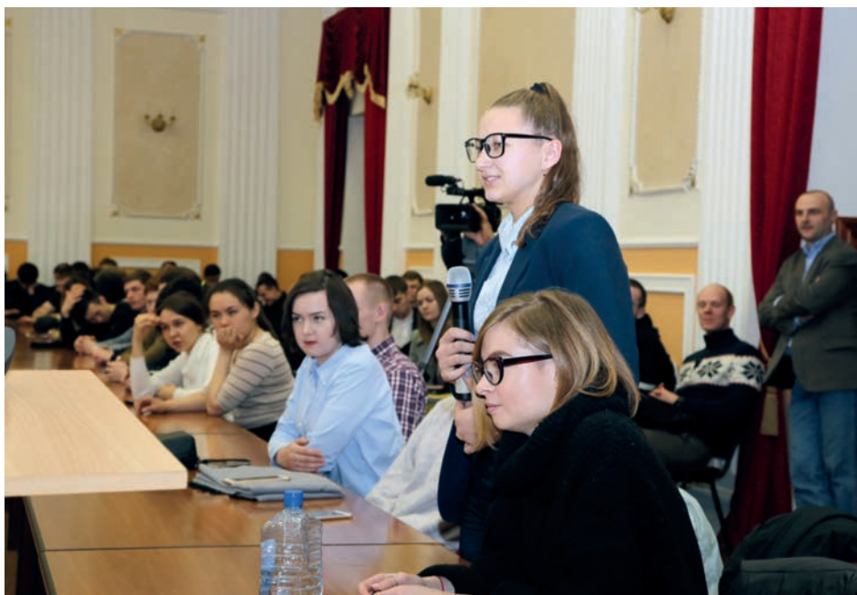
Студенты УГУ на встрече с руководством компании СУБР

Мы практикуем несколько форм взаимодействия с работодателями: встречи со студентами, презентации, ознакомительные экскурсии и